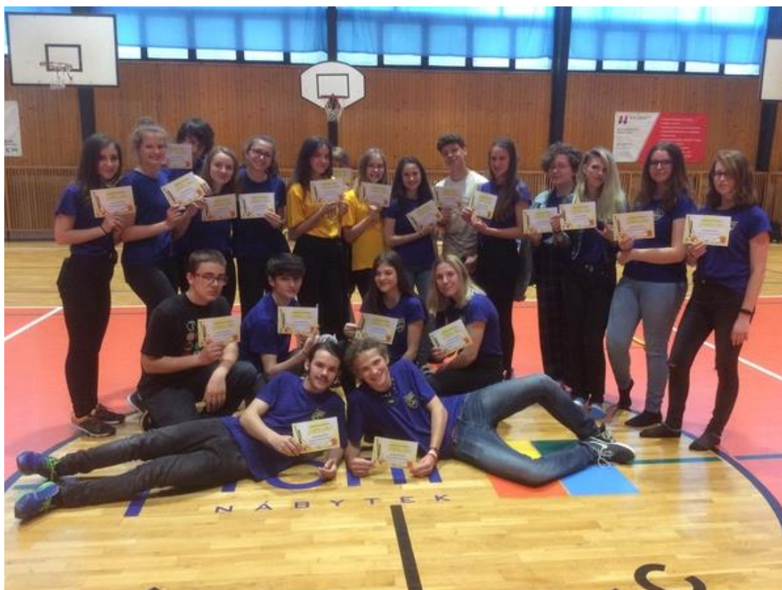
Třída kvarta organizovala Sportovní hry seniorů.